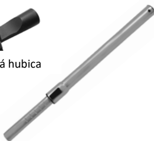
Nerez teleskopická trubica