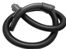
Hadica s rukoväťou